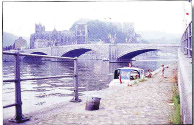
Aan de kade in Namen (tussen sluis 9 en 10)

Deze reis hebben we 115 sluisen 'genomen', 820 km gevaren en 120 diesel verbruikt. Vanaf Den Bosch gerekend hebben we 9 vaardagen heen en 7 vaardagen terug afgelegd in 25 vakantiedagen. Volgens het kaartenboek (Navicarte no 9) zijn behalve enkele vervallen sluisen in België de grootste veranderingen de automatisering van de sluisbediening.