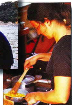
"de schipper 40 jaar geleden en de schipperse ook 40 jaar geleden"