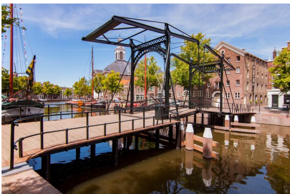
Een van fraaie bruggen in Schiedam

Neem nu die prachtige oude molens die torenhoog aan het water oprijzen. Ze werden wel voor de jenever productie gebouwd, maar toch !