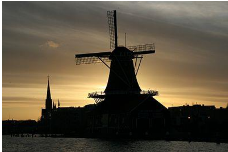
Molen De Salamander langs de Vliet in Leidschendam

Deze keer zijn we niet door Rotterdam naar de Nieuwe Maas gevaren maar door Schiedam.