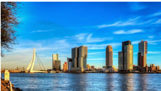
Rotterdam Skyline vanaf de Maas

En dan is er nog zo'n uitdrukking die elke vijf tellen wordt gebruikt : 'stuurboord – stuurboord passeren'. Voor de duidelijkheid, je hoort elkaar, als je de goede wal aanhoudt tenminste, te passeren met bakboordzijde schip langs bakboordzijde andere schip. Maar nu gaat het anders; denktje he ?