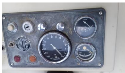
Het originele dashbordje !

In de zomer ook al een begin gemaakt met het vervangen van de oude elektra.