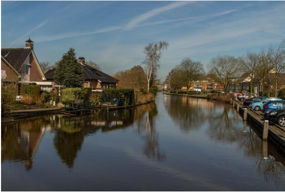
De gekanaliseerde Hollandse IJssel

Het leuke van die markt daar is ook, dat wanneer je moe wordt van al die mensen en het slenteren, je heel dichtbij de grote stadsbibliotheek hebt. Met toiletten dus, en een groot terras met drankjes en hapjes, dat uitkijkt op de markt. Daar zit je dan heerlijk. In de middag zijn we verder gevaren naar Gouda en daar de ( gekanaliseerde ) Hollandse IJssel op naar onze thuishaven.