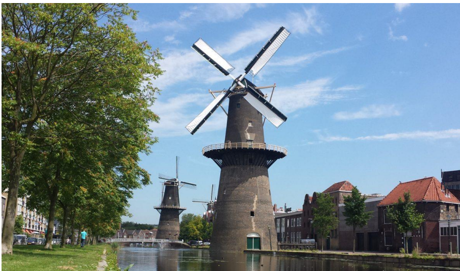
De stellingmolens in Schiedam

Deskundigen hebben mij verzekerd dat zo'n molen bij een stevige wind een netto vermogen levert van wel 50 kilo Watt.