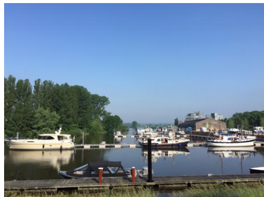
De vernieuwde jachthaven in Doesburg

Dan naar Zwolle en verder naar Meppel, waar we de boot verlieten om een dag of 5 met vrienden door Drenthe te gaan fietsen. We hebben overnacht via "Vrienden op de Fiets", die Bed, Bad en Breakfast bieden voor een vrienden prijsje.