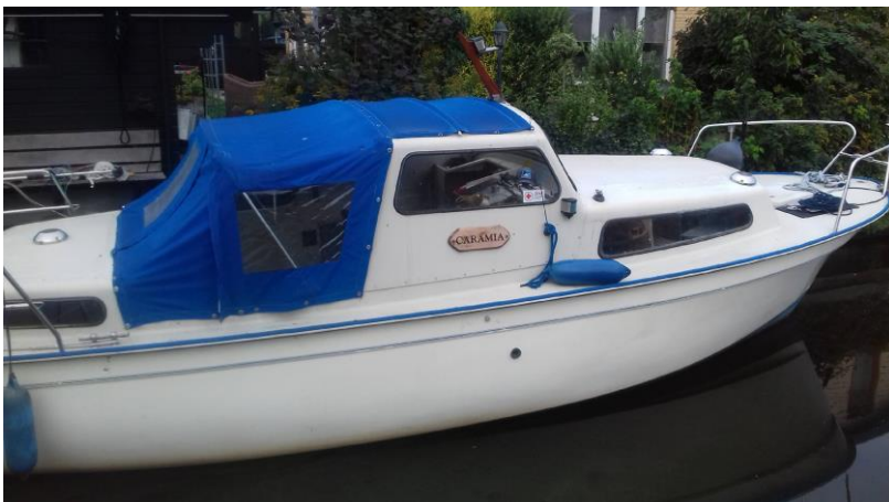
Een wat "vermoeide Caramia"