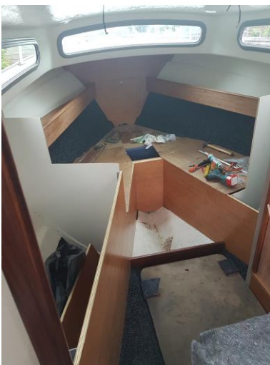
De opbouw van het interieur