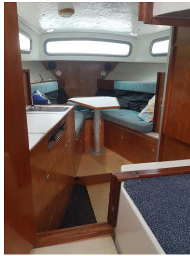
Eindresultaat; als nieuw