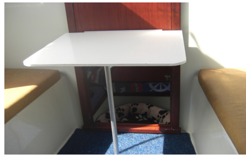
kleinere tafel achter