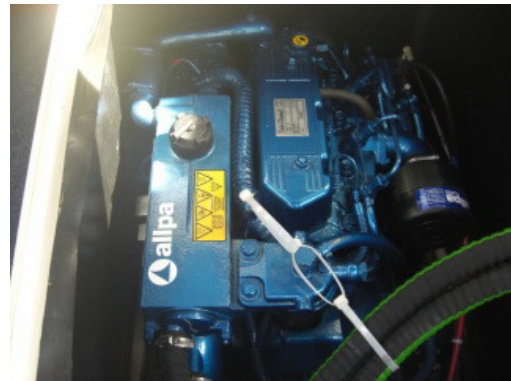
Een nieuwe motor geplaatst