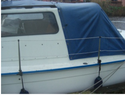
zelf ruiten en rits gemaakt