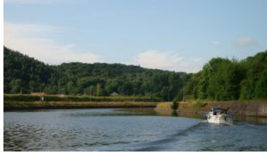
Zo kan het ook