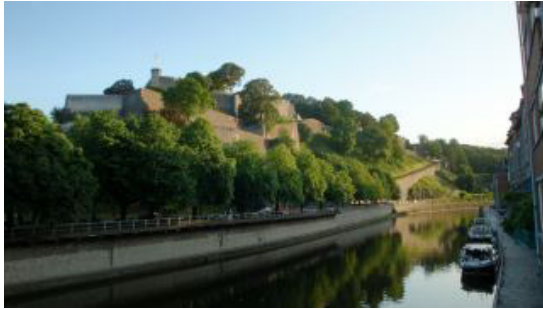
Citadel van namen