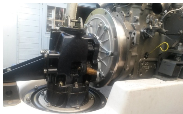
De in te bouwen Saildrive!

Dan hebben we nog een ander nieuwtje voor u! Een van de aangesloten leden van de Kring, eigenaar van een Albin 21, is de verouderde technische installatie in zijn boot helemaal beu. Plaatste hij afgelopen voorjaar al een nieuwe motor, nu is de aandrijving aan de beurt. Nu wil het geval dat in de 21 de motor achterstevoren tegen de spiegel geplaatst is en via een V-drive de schroef aandrijft. De V-drive zorgt voor nogal wat problemen, en dus gaat de hele boel er nu uit.....om vervangen te worden door een z.g.n. Saildrive!