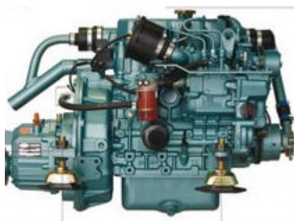
Een mooie compacte 3 cilinder van Mitsubishi, zeer geschikt voor een Albin 25

In nieuwe motoren is behoorlijk keuze. Ten eerste hoeft dat beslist geen 35 of meer pk motor te zijn; de 20 pk welke Albin indertijd inbouwde was al ruim voldoende. Als u dan ziet hoeveel keus er is in motoren rond die 20 a 25 pk....dan zult u zien dat er grote prijsverschillen zijn. En zonder welk merk dan ook te kort te willen doen, het zijn vrijwel allemaal motoren gebaseerd op de oersterke Mitsubishi industrieblokken. Enig marktonderzoek is dus lonend, en mocht u er niet uitkomen.....dan staan wij u graag bij in de bepaling van uw keuze. Immers, door de vele contacten kunnen we terugvallen op veel ervaring, naast het feit dat we zelf inmiddels ook meerdere motoren hebben ingebouwd.